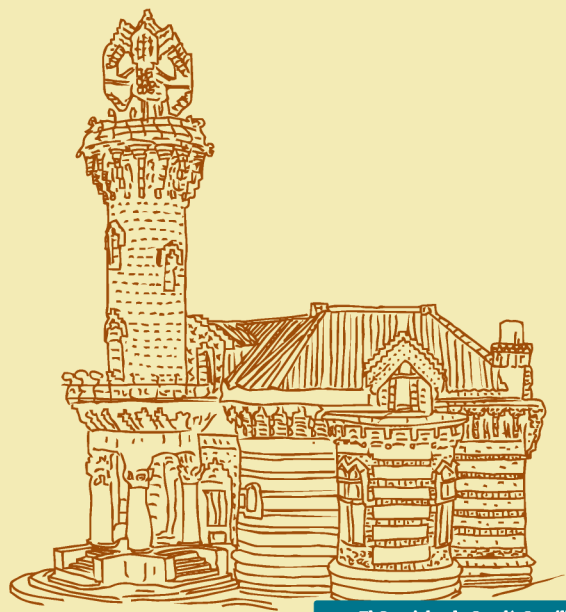
El Capricho de Gaudí, Comillas