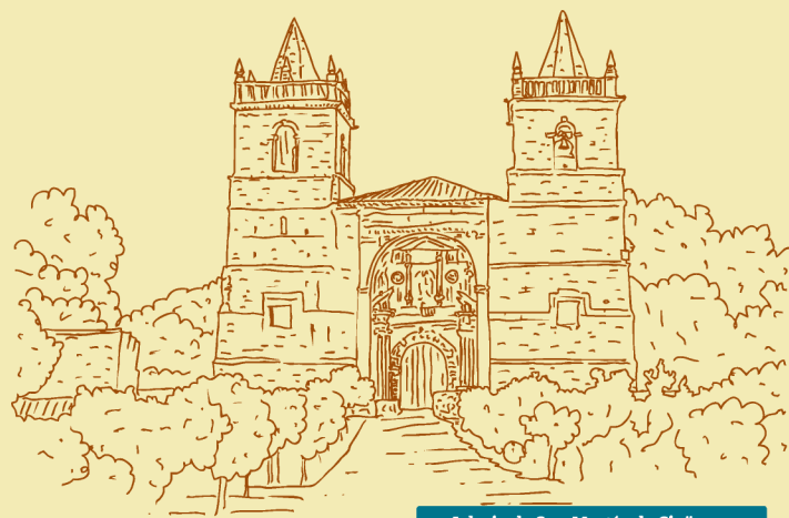
Iglesia de San Martín de Cigüenza