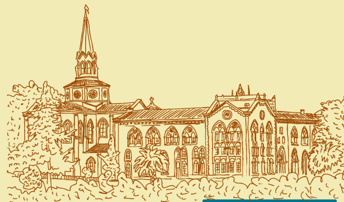
Abadía Vía Coeli, Cóbrecos