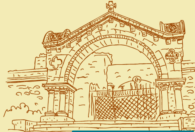
Fachada principal del cementerio de Comillas