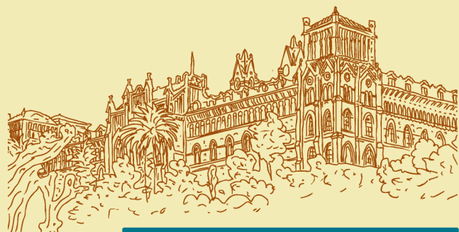
Edificios y jardines de la Universidad Pontificia, Comillas