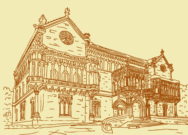
Palacio de Sobrellano, capilla-panteón y parque, Comillas