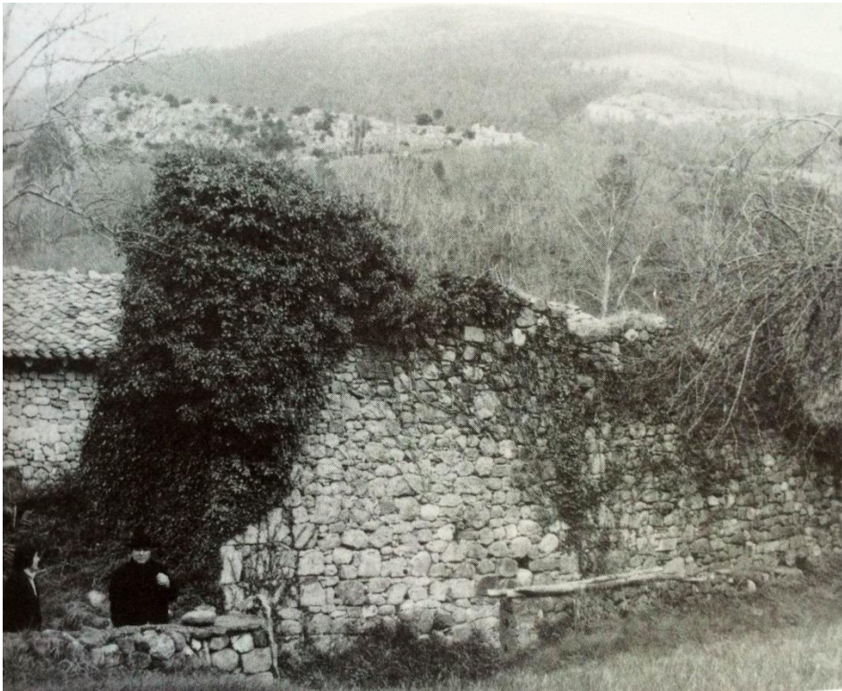
Puerta y ruinas del hospital para peregrinos de GURIEZO