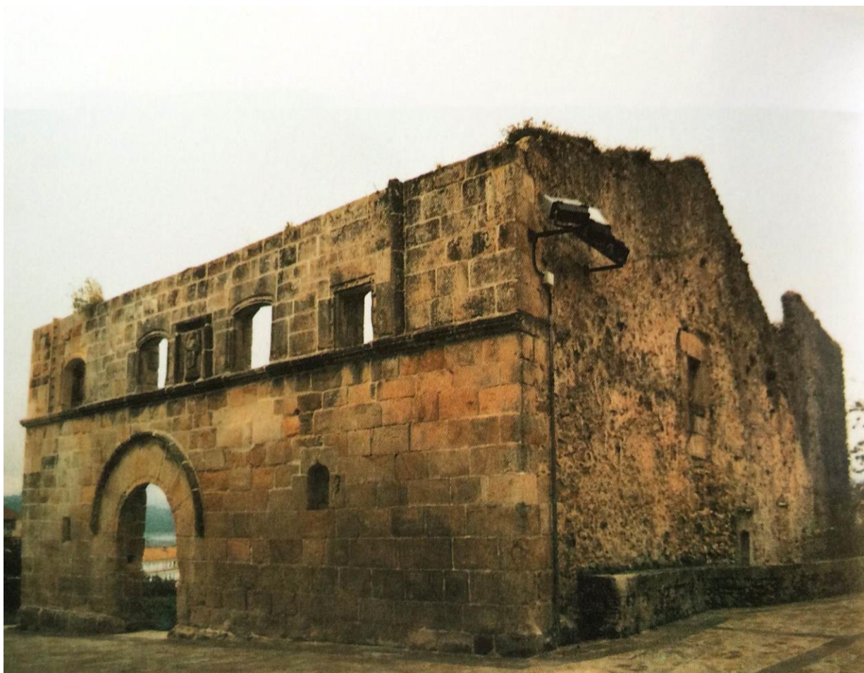
Hospital de Peregrinos de la Misericordia, junto a la Iglesia de Santa María de San Vicente de la Barquera